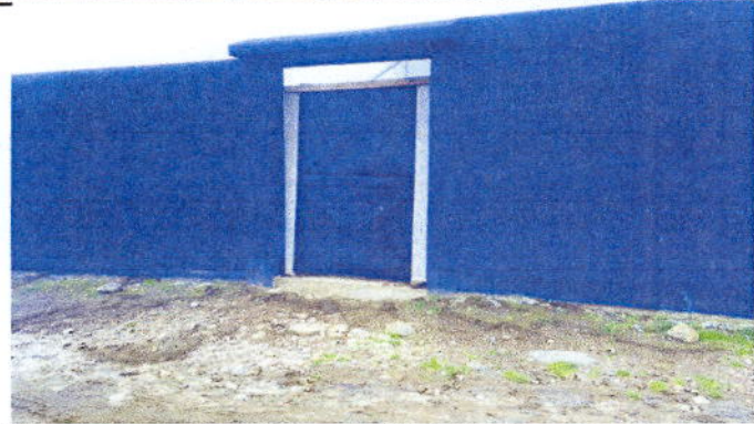
Foto 1: Sustrucción de puerta de metal por puerta de metal principal