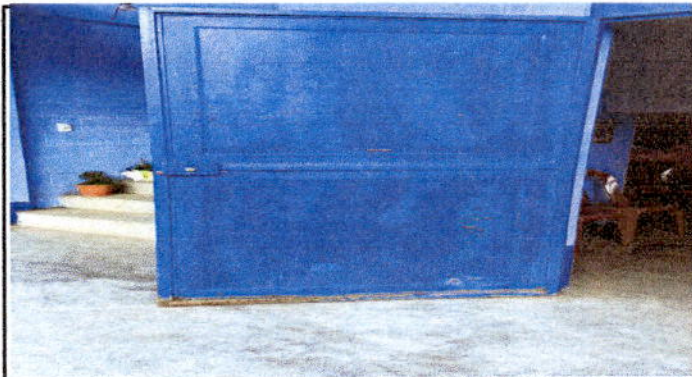
Foto 3: mantenimiento de pintura y estructuras a 9 puertas y cambio de dos chapas