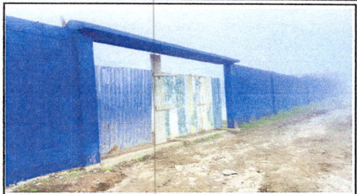
Foto 2: Sustrucción de porton de lamina y madera por sustrucción de porton de metal principal.