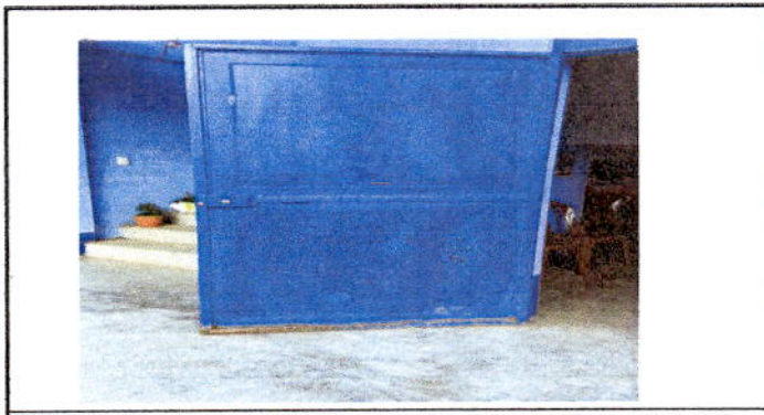
Foto 5: Sustrucción de dos chapas en dos puertas por Chapas de metal